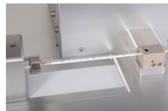
x-Achse und Katheterblock