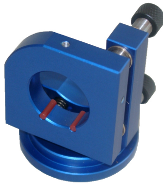
Präzisionsspiegelhalter 1" (Standardausführung)